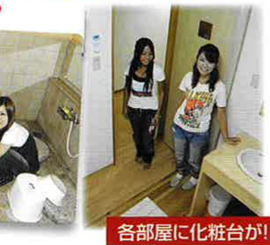
各部屋に化粧台が!