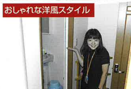
明るい部屋 おしゃれな洋風スタイル

お部屋のタイプはお好みにあわせて。 アットホームを大切にしたい、快適ぞろいです。