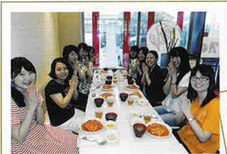
おいしい食事をめしあがれ♪

おしゃれなロザリアンカフェ「ミロ」。 お友達と、ちょっとステキな時間を過ごしてみよう?