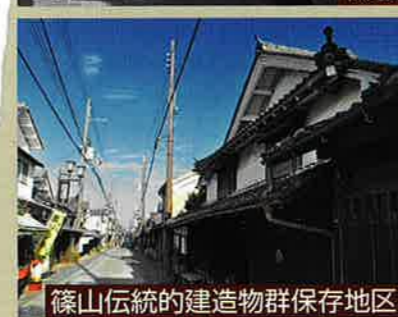
篠山伝統的建造物群保存地区