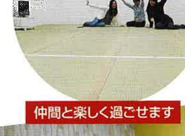
仲間と楽しく過ごせます