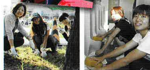
校内清掃 やっぱりきれいになるのは きもちいいもんです トイレ清掃 実は人気のある掃除 です

ボランティアを通じて貯めた心のお金を、 レクリエーションで使おう! ボランティア活動は ●校内清掃・・・(初回8$, 2回目以降5$進呈) ●トイレ清掃・・・(初回10$, 2回目以降5$進呈) ●教習車の洗車(普通車と二輪5$進呈) ●近隣清掃・・・(初回8$, 2回目以降5$進呈) 活動ごとに進呈$(ポイント)が決まっています、 カードに押印していく仕組みです。 貯めた$(ポイント)は校内にある、カフェ「ミロ」 やミニショップで使えます。