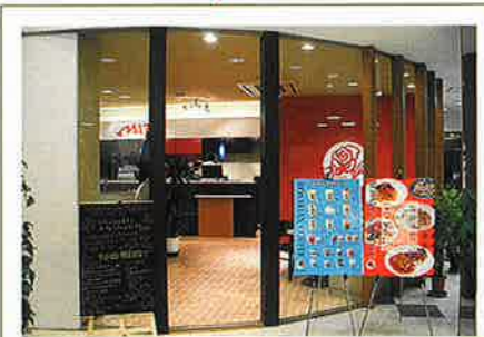
校内のおしゃれなお店 「カフェ・ミロ」