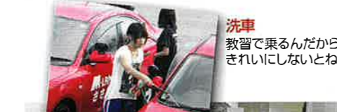
洗車 教習で乗るんだから きれいにしないとね!