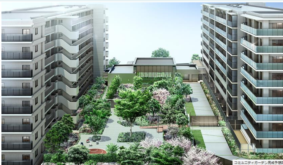
コミュニティガーデン完成予想図

「梅田」駅 直通27分・「千里中央」駅 1駅3分 阪急「山田」駅 徒歩11分 ※1 / 大阪モレール「山田」駅 徒歩10分 ※1