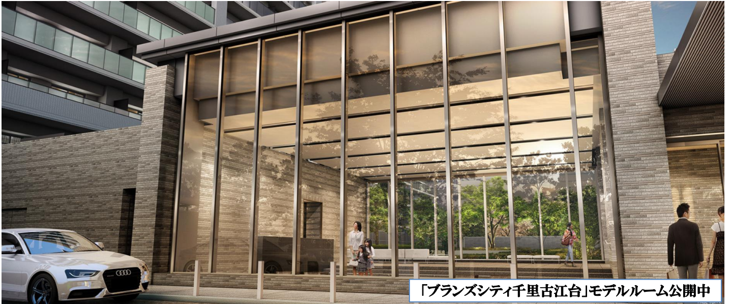
「プランズシティ千里古江台」モデルルーム公開中