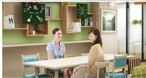
木のぬくもりが漂う「ライブラリーカフェ」は、東急ハンズらしいハンドメイド感覚の空間に仕上がりました。