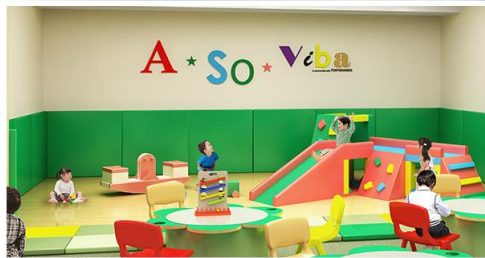
屋内のキッズルーム「A・SO・Viba」は、多くの知育玩具を揃えて好奇心旺盛な子ども心をくすぐる空間デザインに。