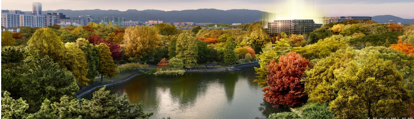
千里南公園と外観 Brillia City Senri Tsukumodai

外観完成予想図 ※掲載の完成予想図は南千里駅前モデル西側最上階から撮影(2016年11月13日)に、設計図面に基づいて描いたCGを作成したもので、行政官の指導、施工上の都合により、外観・外構・仕舞・色調・植栽等が変更となる場合があります。