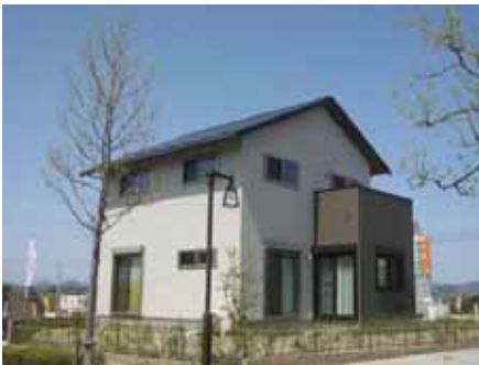
太陽光発電(5.544kW)、エネファーム