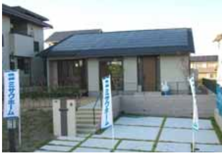
太陽光発電(10.50kW)、オール電化住宅、蔵のある家