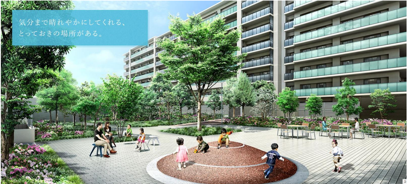
千里ニュータウン、古江台の最前席に誕生する全254邸の大規模プロジェクト。