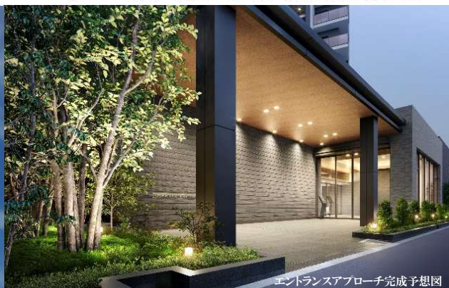
エントランスアプローチ完成予想図