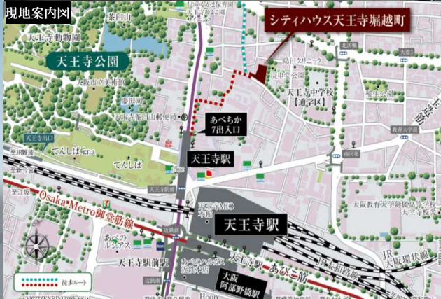
※掲載の地図は一部道路等抜粋して表記しています。