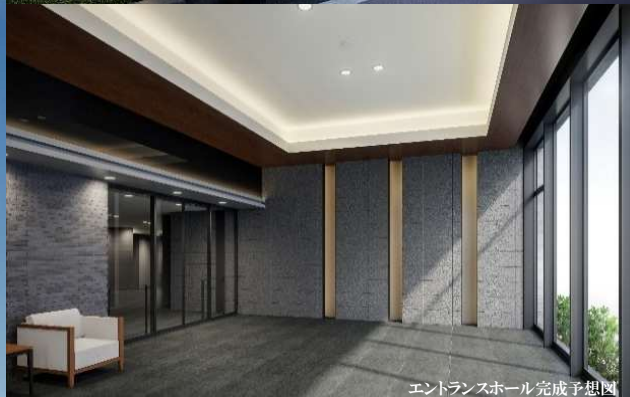
エントランスホール完成予想図