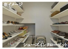
シューズインクローゼット