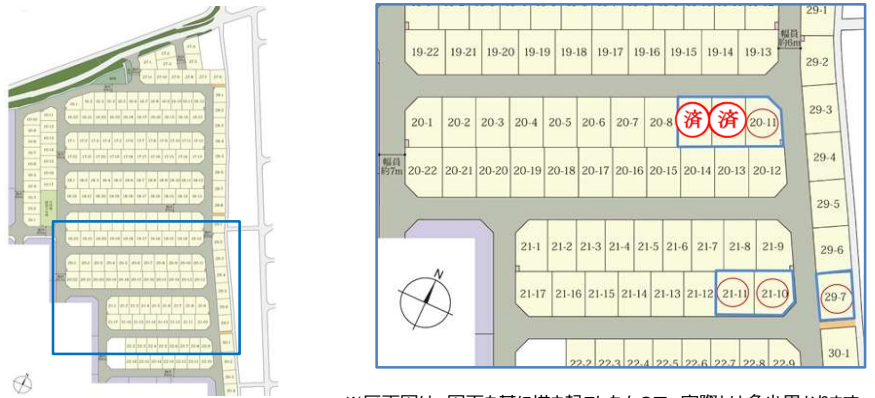
※区画図は、図面を基に描き起こしたもので、実際とは多少異なります。