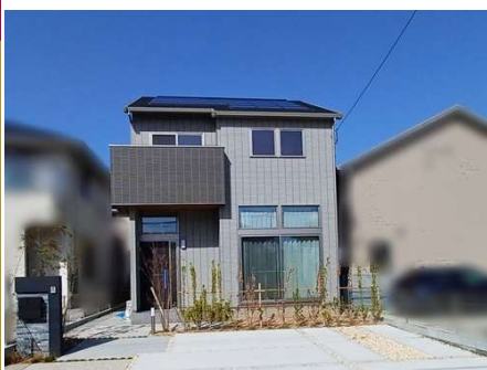
太陽光発電(3.36kW)、蔵のある家