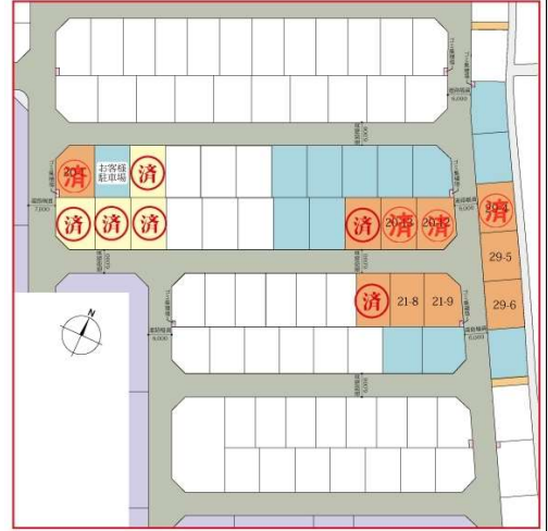
※区画図は、図面を基に描き起こしたもので、実際とは異なります。