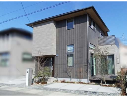
太陽光発電(4.56kW)、オール電化住宅

JR宝塚線「中山寺」駅まで徒歩16分 または阪急宝塚本線「中山観音」駅まで徒歩27分