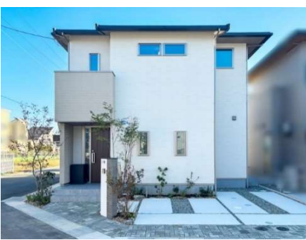
太陽光発電(3.48kW)、オール電化住宅

JR宝塚線「中山寺」駅まで徒歩16分 または阪急宝塚本線「中山観音」駅まで徒歩27分