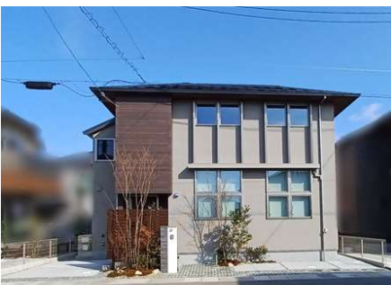
太陽光発電(4.48kW)、オール電化住宅

JR宝塚線「中山寺」駅まで徒歩16分 または阪急宝塚本線「中山観音」駅まで徒歩27分