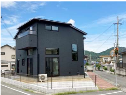
太陽光発電(3.07kW)、オール電化住宅、蔵のある家