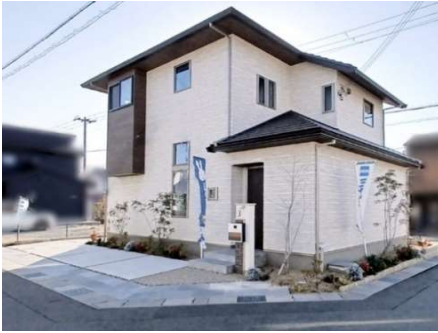
太陽光発電(4.71kW)、オール電化住宅

山陽電鉄網干線「広畑」駅まで徒歩14分、 JR山陽本線「英賀保」駅まで徒歩22分、または「はりま勝原」駅まで徒歩22分