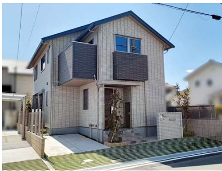
太陽光発電(3.88kW)、エネファーム